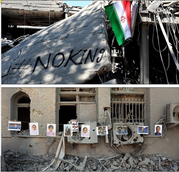
عکس‌های این گزارش مربوط به حمله آمریکایی-صهیونی به دانشگاه شریف است

سکوت سنگین اسلحه‌ها در مرزها و توقف موقتی پرواز پهپادها در آسمان، اگرچه فرصتی برای نفس کشیدن شهروا فراهم کرده است اما برای اهالی اندیشه و ثبت‌کنندگان وقایع، آغازگر نبردی دشوارتر و پیچیده‌تر به نام جنگ روایت‌ها است. با احتمال دستیابی به توافق آتش بس دو هفته‌ای میان ایران و آمریکا–اسرائیل در روزهای گذشته، پس از روزهایی پرالتهاب که از اسفند آغاز شده بود، حالا جامعه با پرسشی حیاتی روبروست؛ چه کسی داستان این روزهای پرالتهاب را روایت خواهد کرد؟ تاریخ‌نگاری و تاریخ شفاهی در این مقطع، نه تنها یک فعالیت علمی، بلکه یک ضرورت امنیت ملی و ابراز برای بازیابی هویت ملی تلقی می‌شود. در حالی که هنوز بوی سوختگی از دیوارهای تخریب شده دانشگاه صنعتی شریف و علم و صنعت و موزه‌های آسیب‌دیده اصفهان یا تهران به مشام می‌رسد، ثبت دقیق جزئیات، تنها راه مقابله با تحریف‌هایی است که معمولاً در دوران پس از جنگ به راه می‌افتند.