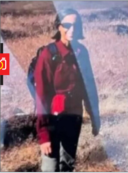
تصویر ورتن از دانشمندان کشته شده در آمریکا

همچنین نام افرادی مانند فرانک مایوالد از آزمایشگاه پیشترانش جت ناسا، استیون گارسیا از پیمانکاران امنیت هسته‌ای در کانزاس سیتی و ژنرال بازنشسته نیروی هوایی ویلیام نیل مک کاسلند که در پروژه‌های مرتبط با لوس‌آلاموس فعالیت داشته، در این فهرست مطرح شده است. در برخی از این پرونده‌ها،